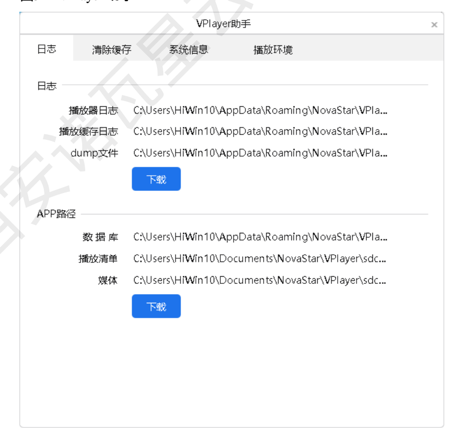
图5-2 VPlayer 助手