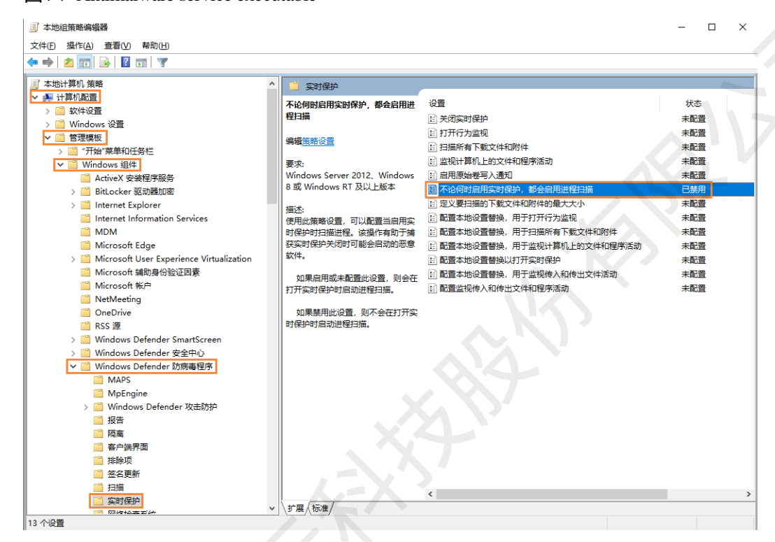
图4-7 Antimalware service executable