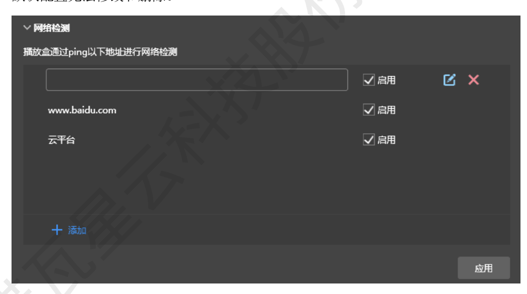
步骤 3 启用或停用检测地址。