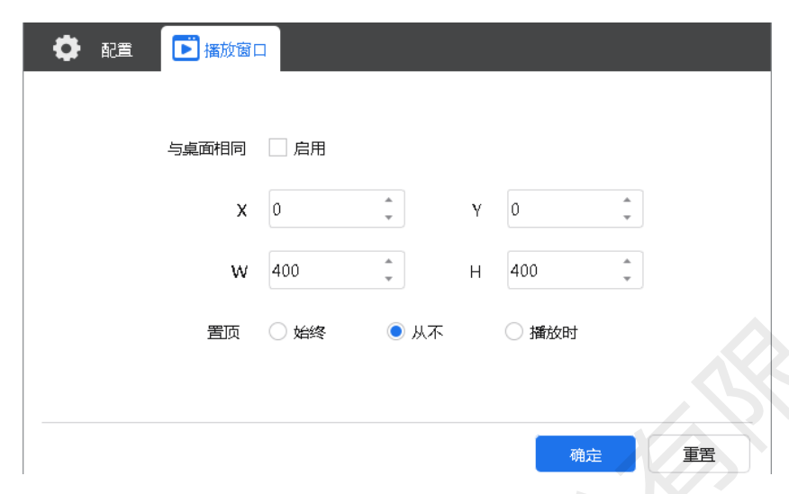
步骤 3 设置播放窗口位置、大小和置顶规则。 如果启用"与桌面相同",则播放窗口与桌面大小一致。